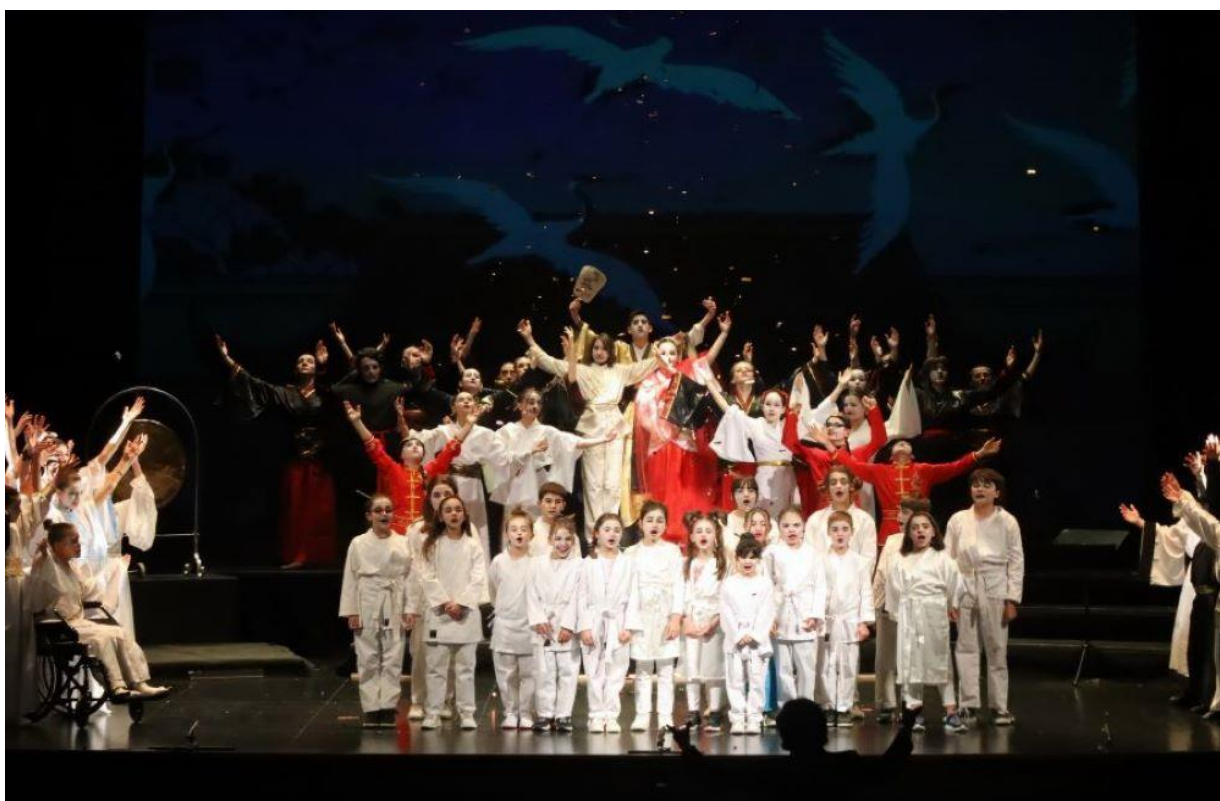
Foto d'insieme dello spettacolo "L'amore vince!" andato in scena al Teatro Sociale di Sondrio il 5 maggio 2024

Bilancio sociale predisposto ai sensi dell'art. 14 del decreto legislativo n. 117/2017